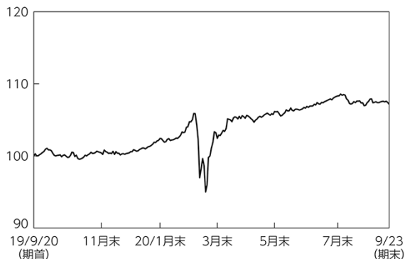
シュワブ U.S.アグリゲート・ボンドETF