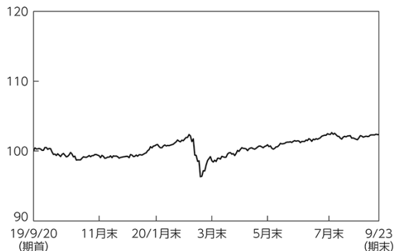
バンガード・トータル・インターナショナル債券ETF (米ドルヘッジあり)