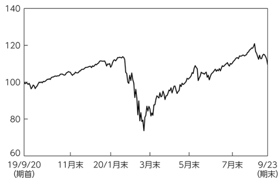
シュワブ U.S.ブロードマーケットETF