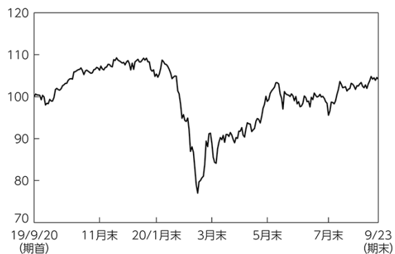
iシェアーズ・コア TOPIX ETF