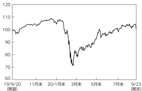
SPDR ポートフォリオ・ディベロップドワールド (除く米国) ETF