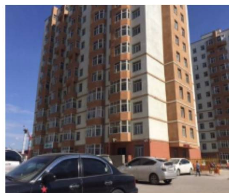
図4：高所得者向けの高級不動産 【出所】ハーベスト グローバル インベストメント