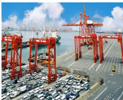
物流ハブとして存在感を高めるスリランカ（コロンボ港）