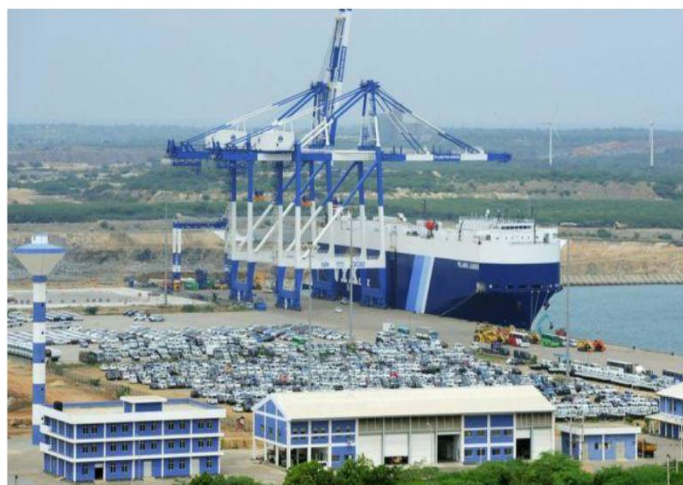
図1：一帯一路政策の戦略的要衝-スリランカのハンバントタ港