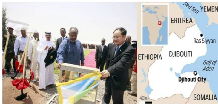
図2：ドラレ多目的港-ジブチ共和国の戦略的拠点